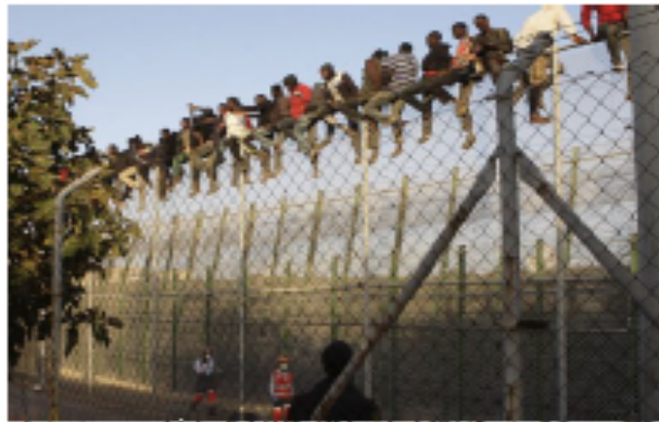
Inmigrantes en una valla de Melilla el 11 de octubre de 2014.

Por: Autor invitado | 07 de noviembre de 2014