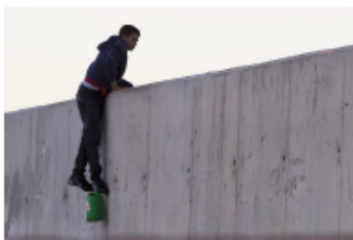
Un inmigrante menor intenta entrar en Ceuta a bordo de una escalera.

Andalucía en | Fotos: Esteban Olibar | Fotos | Inmigración | Inmigración irregular | África | Política | Política regional | Política | Problemas sociales | Demografía | Sociedad