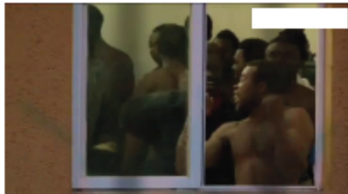
CIRCA DE 100 SON INPELLOS EN CEUTA Y MELILLA. Los subsaharianos acuden a la ciudad por el permiso de la viga o cerca el punto de venta otro.

Arredondo.eu Melilla Ceuta SaharaMarruecos Inmigrantes Servicios emergencias Marruecos Inspección Inspección Irregular Migración Emergencias AfricaSubsahariana Política migración África Política España Migración Fuerzas seguridad Denegación Sucesos Sociedad Justicia